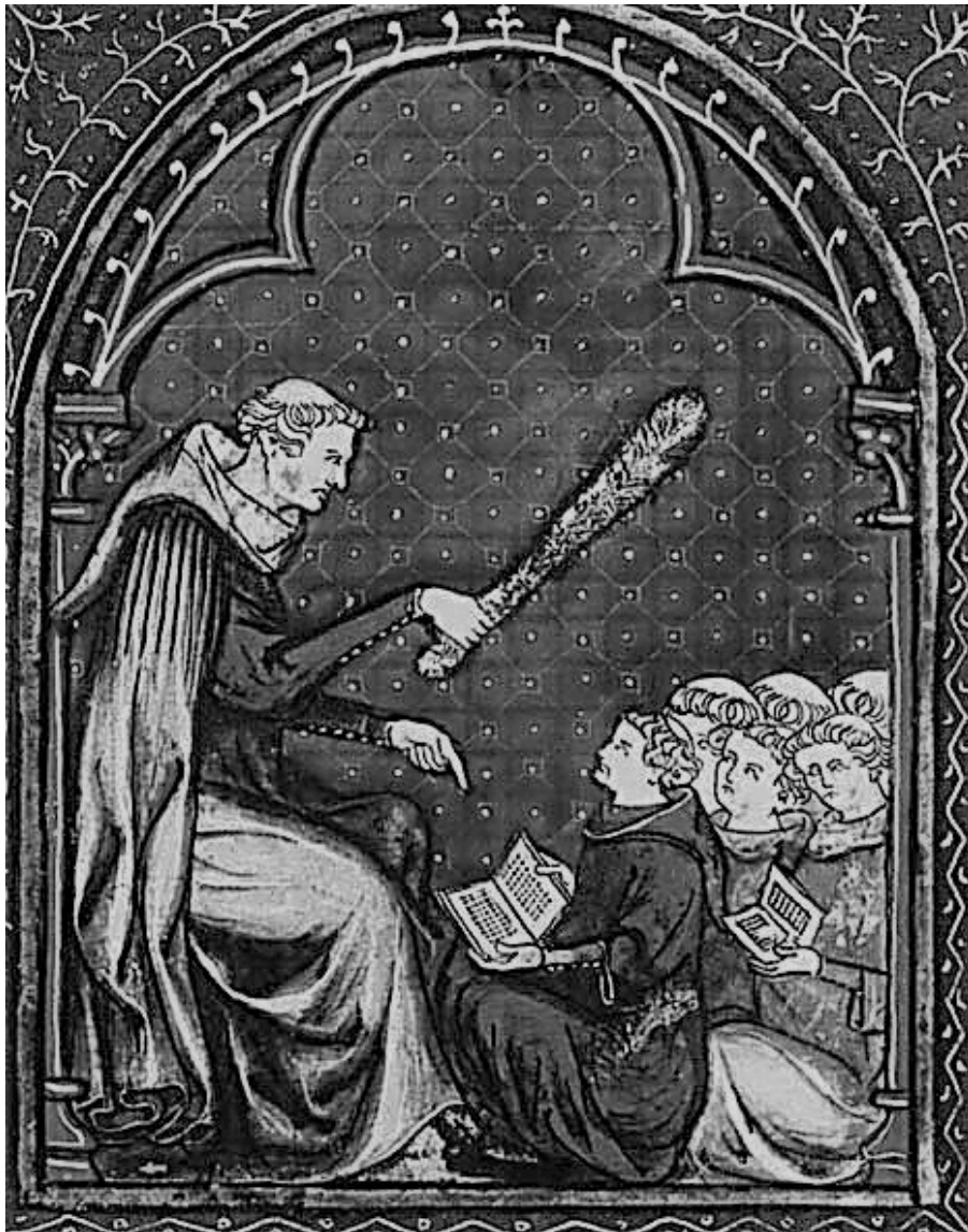
Sous la férule du maître.